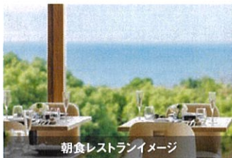
朝食レストランイメージ