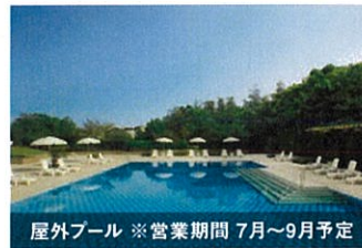
屋外プール ※営業期間 7月~9月予定