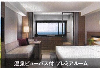
温泉ビューバス付 プレミアムルーム