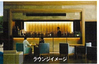
ラウンジイメージ